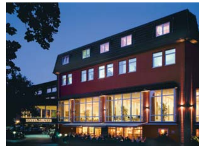
Ringhotel Munte am Stadtwald www.hotel-munte.de