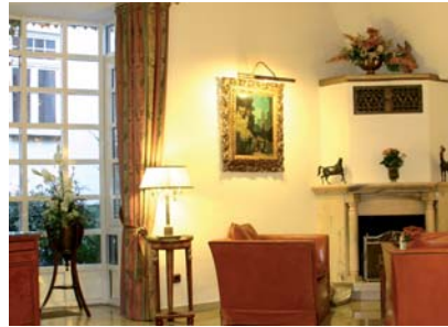
Hotel Eden www.eden-hotel.de